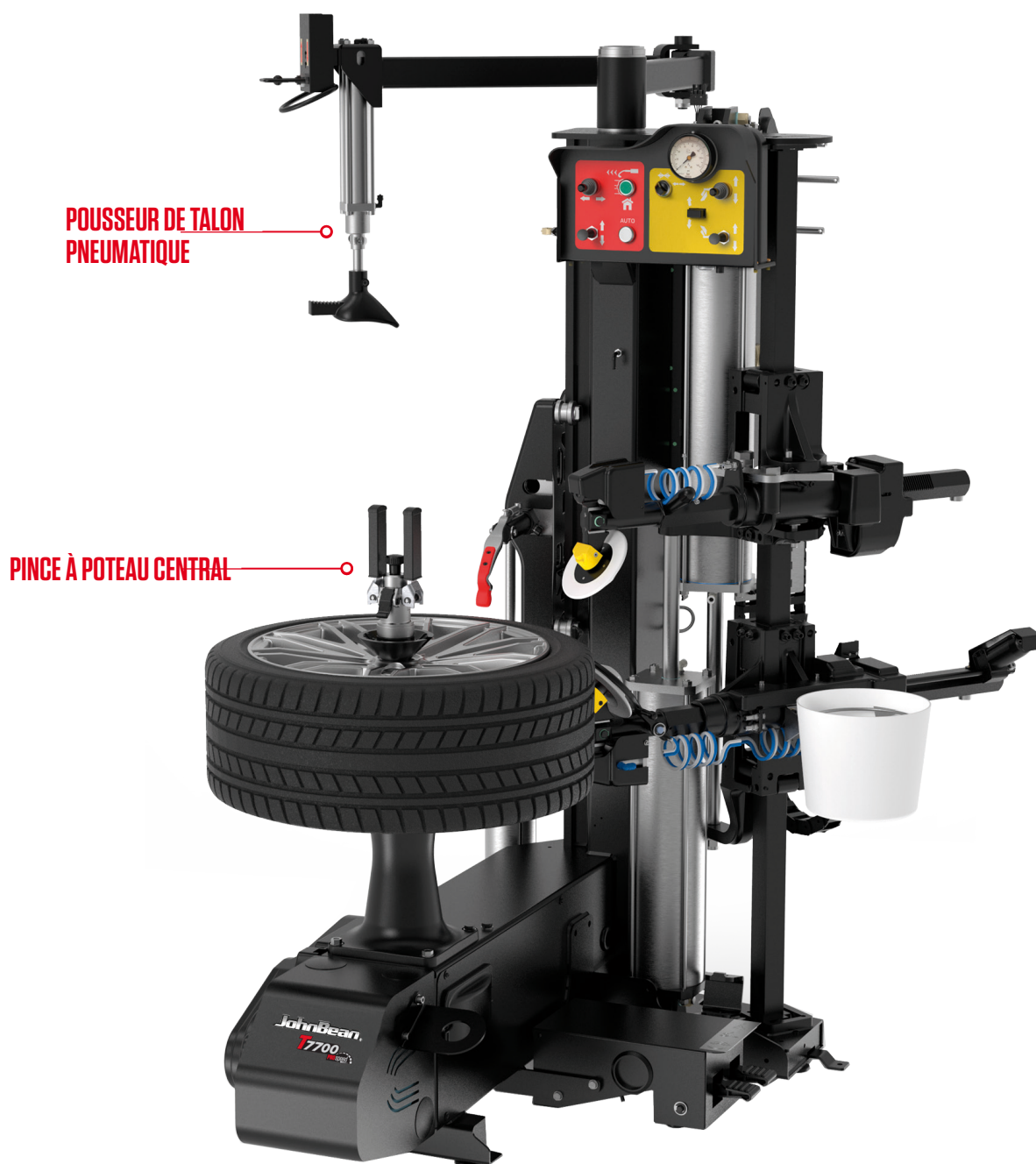
POUSSEUR DE TALON PNEUMATIQUE