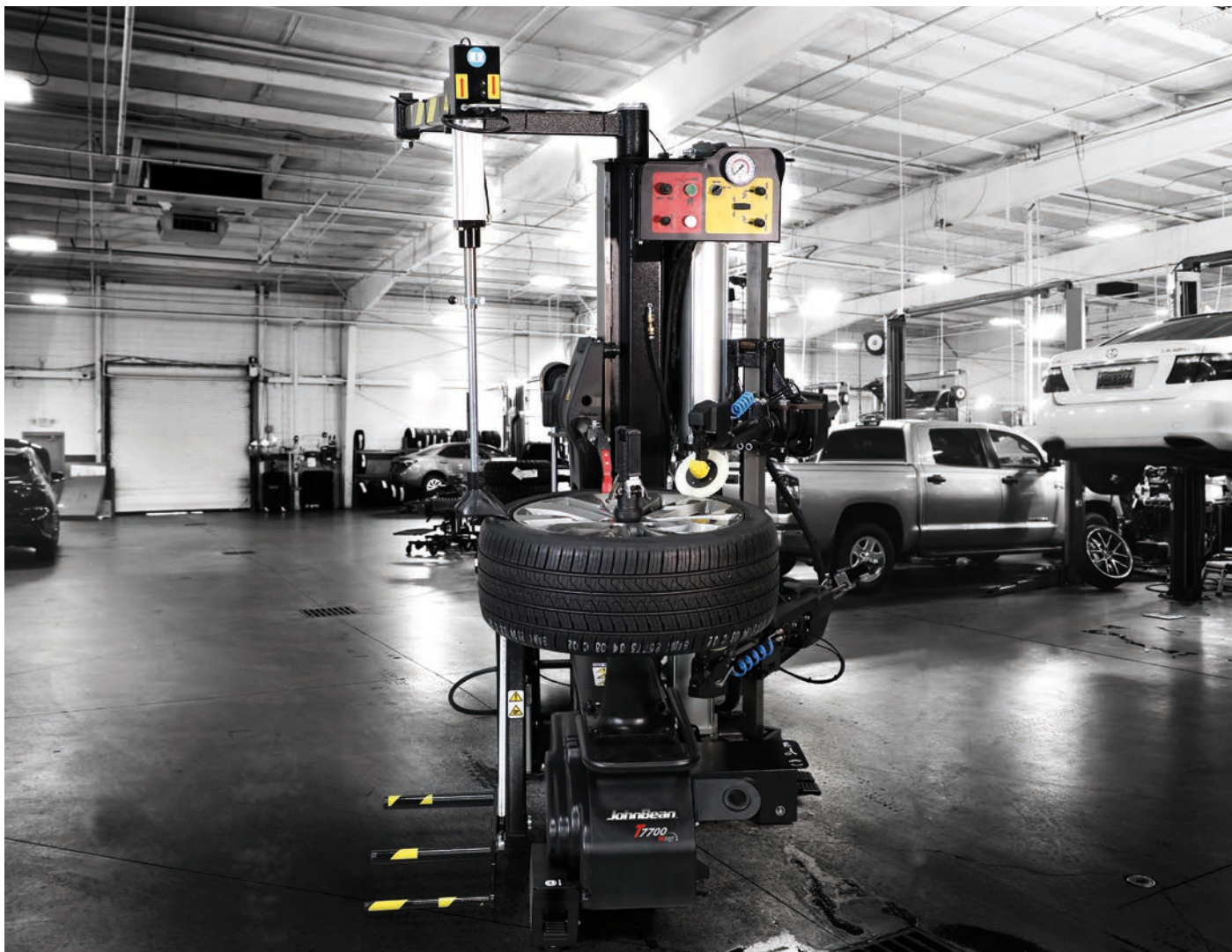
Mostrato con il sollevatore pneumatico opzionale.